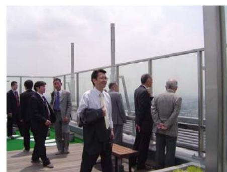
屋上からの眺望 多摩川が近く感じられます