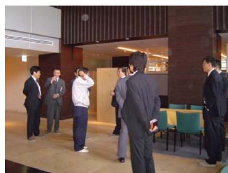
作業所長より施設の説明をうけました