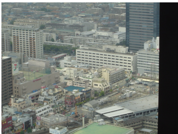
ザ・コスギタワーから見た施行予定地区とその周辺

住戸は2LDK～4LDK（専有面積は58㎡～123㎡（平均79㎡））と豊富な住戸メニューとなっています。