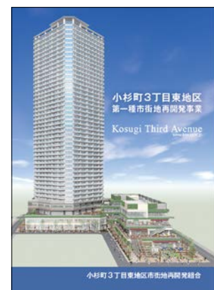
事業概要パンフレット

事業概要パンフレットを設立総会にて配布しましたが、ご入用の方は事務局までご連絡下さい。