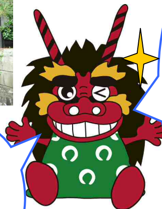
文化財保護活用推進キャラクター シッシー君